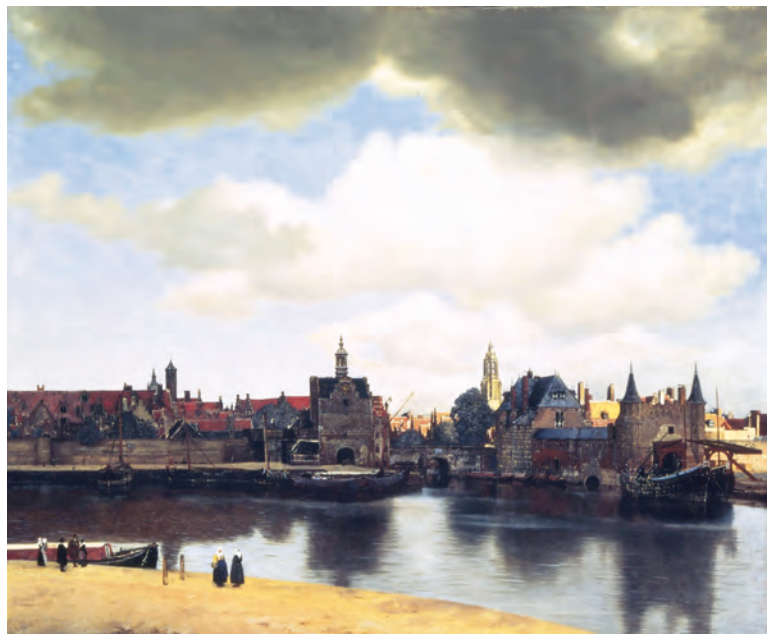
Vermeer, "Utsikt över Delft"

I vårt val av kända och mindre kända museer har vi naturligtvis med de verkligen stora och tunga samlingarna, Amsterdams Rijksmuseum med verk från Hollands guldålder, bl.a. Rembrandt, Hals, Steen, Vermeer, samt van Gogh Museet med en fantastisk exponering av van Goghs liv och verk, den Haags Museum Mauritshuis med underbara verk av Vermeer och det unika Frans Hals Museum i Haarlem. Vi har också med nutida unika samlingar som t.ex. de i Kröller-Müller-Museet i Otterlo med världens näst största samling av van Goghs verk, COBRA-muséet i Amstelveen med verk av Karel Appel och andra avantgardekonstnärer och nya Groninger Museum , som även ur arkitektonisk synpunkt är sevärd.