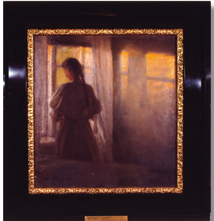
Julius Paulsen, "Vid fönstret", 1895.