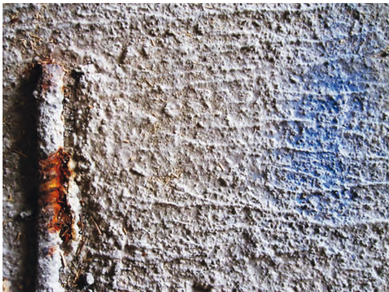
"Concrete and blue"

Museisektorn är satt under stor ekonomisk press samtidigt som avtal med varierande konstnärsförbund pekar mot högre och många gånger skäligare ersättningsnivåer.